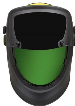
Большой внутренний экран